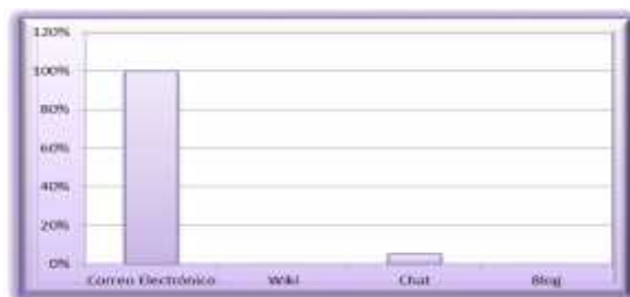
Figura 4. Gráfica Canales de Comunicación

La triangulación de la información obtenida en el diagnóstico arrojó las principales tendencias: