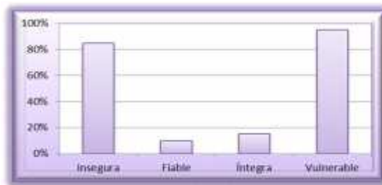
Figura 1. Gráfica Tratamiento de la Información.

Se identificó además, como se puede observar en la gráfica de la Figura 1, que el 95% de los jefes de colectivo de año encuestados considera que el tratamiento de la información es vulnerable, el 85% considera que es íntegra y solo el 10% considera que es fiable.