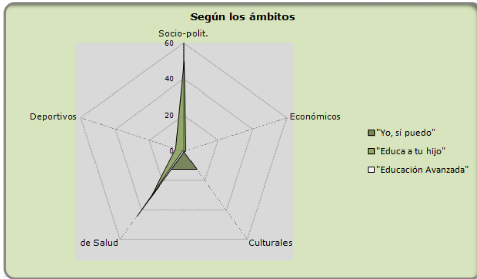
Gráfico No.1: Referencias desde dominios de sitios no educativos.

La tabla de frecuencias que aparece a continuación muestra los datos concretos obtenidos: