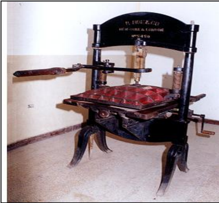
Cuadro 1. Prensa R. HOE & CO New - York & London N° 5450

Además la imprenta consta de una cantidad de tipos tanto de madera como fundidos, letras mayores sin marcas, así como otras, que vistas al microscopio, llevan denominaciones tales como: Barnhart Bros & Spindler Chicago, Bruce New York F. C., Bruce N. Y., Bruce, B. B. S., The Cincin'ti de 64 puntos, 32, entre otras dimensiones. Lo que más abundan son letras sin marca de 12 puntos.