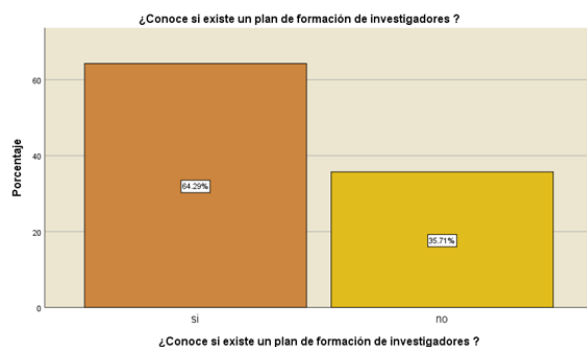
Fig. 2- Conocimiento de los docentes sobre los planes en formación para los docentes que realizan investigación

Una de las estrategias de la UEES ha sido contar con un plan de formación en el área de investigación; sin embargo, únicamente el 64 % de ellos manifestaron conocer acerca del mismo, como se observa en la figura 2.