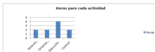
Gráf. 1 - Momentos del trabajo independiente

El cuarto y último momento transcurre en el aula con la participación de los alumnos y el docente, evaluando las respuestas a cada interrogante (2 horas).